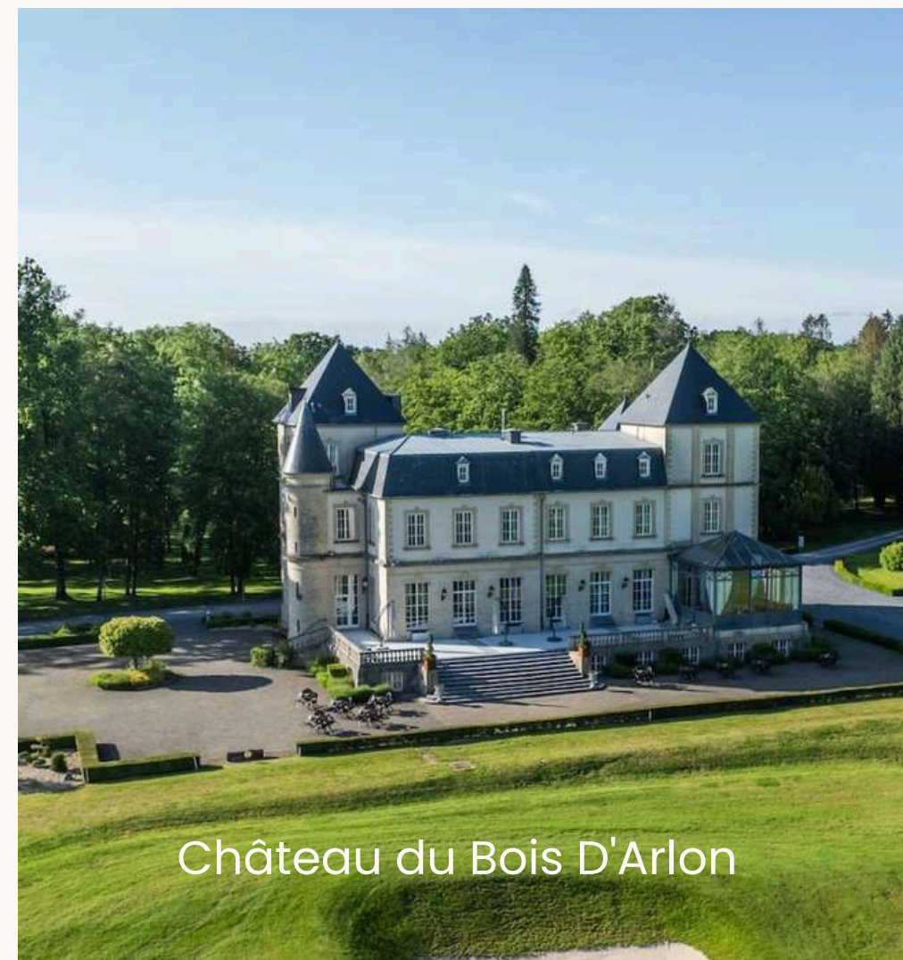
Château du Bois D'Arlon