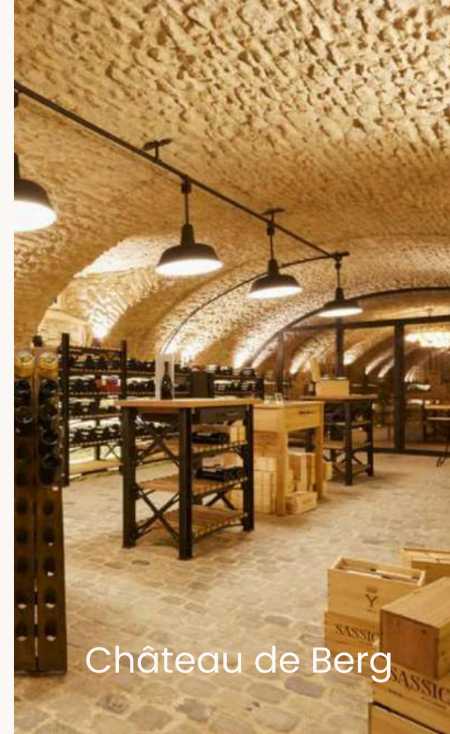
Château de Berg

Haras de la Vannoue | Château du Bois d'Arlon | Château de Preisch | Château de Boucq | Domaine Henri Ruppert | Château Hattonchatel | Domaine Aux Anges | La Grange de Fonteny | Pavillon Blanc Walygator | Kinopolis (Metz – Thionville – Longwy) | Galaxie d'Amnéville | Centre congrès du Burghof | La Porte des Allemands | Abbaye de Neimenster Château de Thillombois | Château Ernest | Ferme du Banneway | Château de La Grange | La Grande Maison de Chazelles | Chalet de L'Orée du Bois | Domaine des Templiers