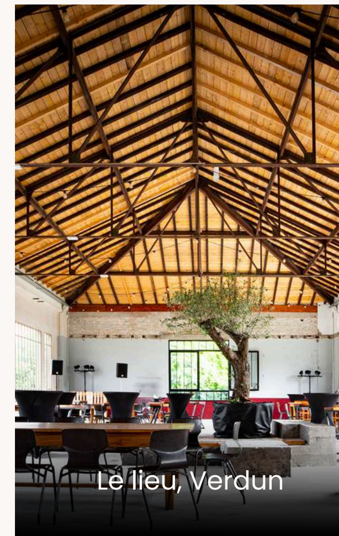
Le lieu, Verdun