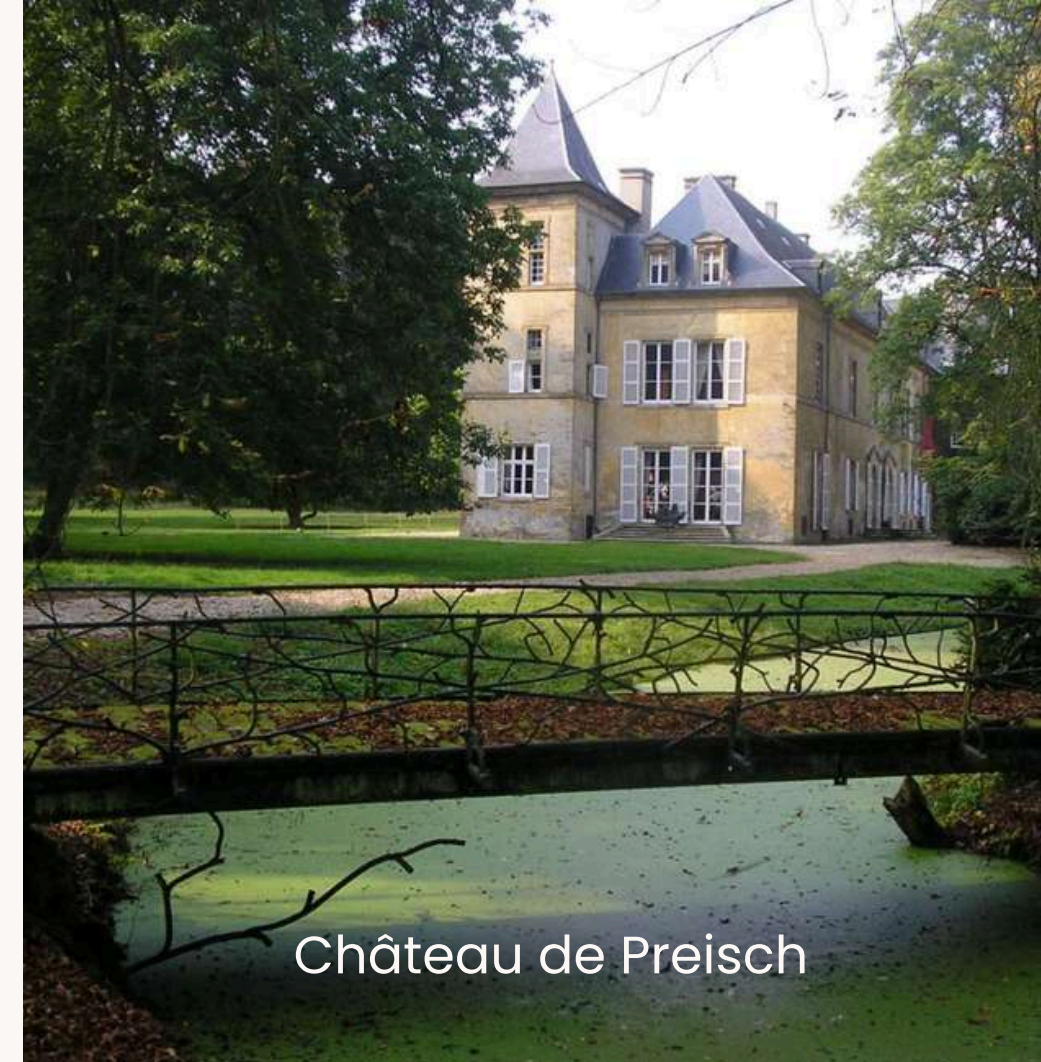
Château de Preisch